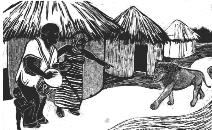
MARKII LIBAAX XAAFADDA YIMAADO KOR U QAYLO DHAAMI

Cudurkan AIDS waa ganacsi khatar ah. Is hilmaansiin jiritankiisa daawaynta ma kaalmayso. Maska qarsoon wuu koraa. Maroodigu waa koraa wuuna waynaadaa ama rab ama ha rabin. Waa arrin aanan ka hadlin laakin loo baahan yahay in laga wada hadlo si looga hortago. Fudayd looma cabo maraq basbaas. Waqtigaaga qaado, kana fakar oo warqadaan akhri. Bilow la hadalka si looga hortago. Naftaada u samee, caruurtaada u samee, qoyskaaga u samee, qabiilkaaga u samee. 6000 afrikaan ah ayaa maalin walba u dhinta AIDS. Haddii annu kuligeen oggolano in aa dhimano, yaa carruurteenna korinaya.